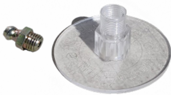
PPW 1138 LAIPPA JA M8 1146K NIPPA