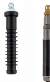
PORATTAVAT RUUVIKIRISTEISET PPW-INJEKTOINTITULPAT